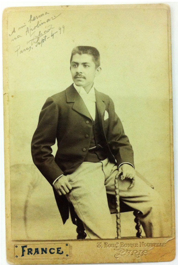
Figura 3. Fotografía de Julián Carrillo en París en septiembre de 1899.

El primer registro, inventario y catalogación se realizó sobre la amplia colección fotográfica que el maestro había reunido durante más de 80 años. Su incansable formación alrededor del mundo y su carácter meticuloso han hecho de su conjunto fotográfico un heterogéneo acervo que reúne no solo imágenes donde él es protagonista sino que existen testigos históricos de grandes acontecimientos que hacen su análisis y estudio documental más rico y complejo.