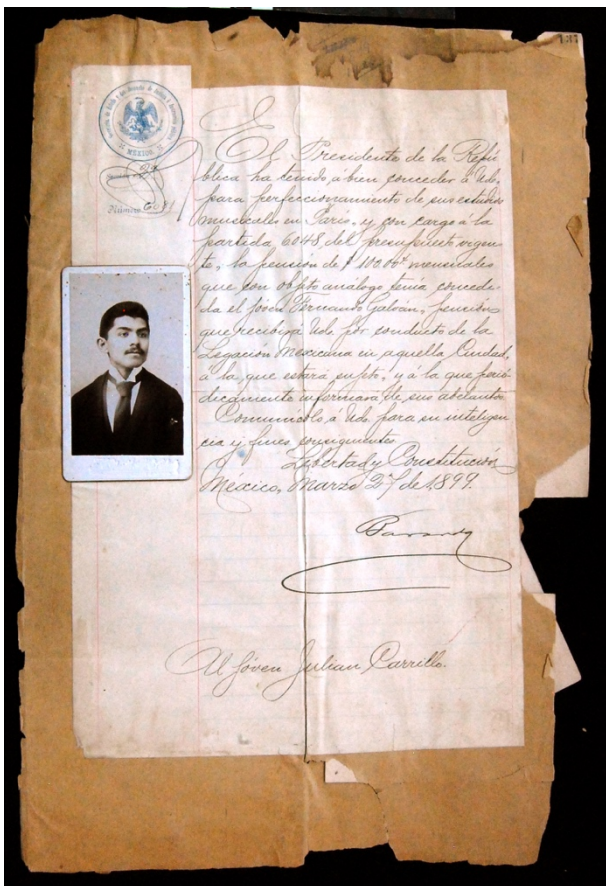
Figura 2. Documento de concesión de la beca de estudios en París. 1899

El registro de los conjuntos seleccionados para su estudio fue el primer paso para conseguir identificar cada objeto y recoger sus principales características. Se emplearon diferentes fichas de reconocimiento adaptadas a las necesidades del proyecto que reunían campos formales, descriptivos y evaluativos.