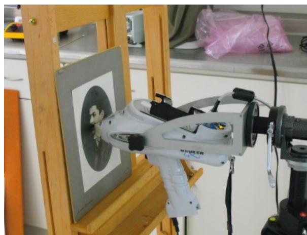
Figura 5. Estudios de FRX durante el Verano de la Ciencia 2014

La aplicación de la FRX como sistema de identificación de los procesos fotográficos resultó una herramienta eficiente en relación a los compuestos inorgánicos presentes en los artefactos fotográficos. Sin embargo, fue evidente la insuficiente información respecto a los materiales orgánicos que juegan un importante papel en la identificación de los aglutinantes que soportan la emulsión.