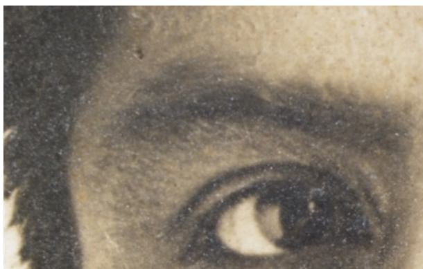
Figura 6. Fotografía a través del microscopio estereoscópico en 0.7x