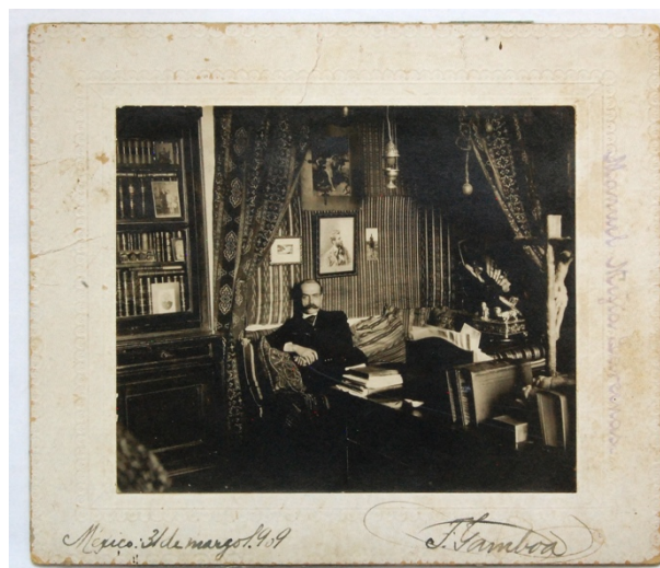
Figura 4. Fotografía del escritor mexicano Federico Gamboa en 1909

Como parte del proyecto se determinaron también los principales factores que estaban ocasionando los deterioros presentes concluyendo con la identificación de los agentes causantes de las patologías más comunes en los materiales fotográficos.