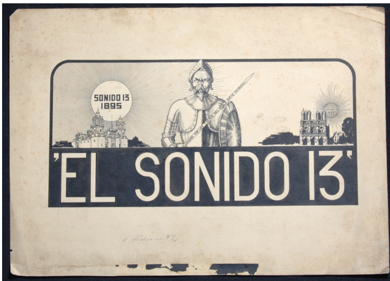
Figura 1. Ilustración original “El sonido 13”.

aportaciones a la historia de la música y de la ciencia. Estos cuestionamientos han provocado no sólo que el maestro Julián Carrillo forme parte de la cultura mexicana como una figura ilustre, el nombre de una calle o de un barrio, sino que la mayoría de los estudiantes y especialistas en el campo musical lo desconozcan o lo rechacen de forma rotunda.