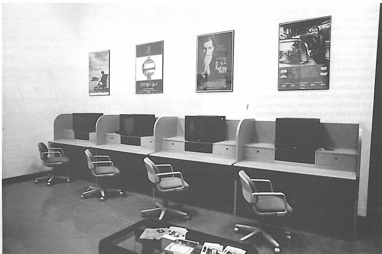
Sala de visionado

Por último, dentro do apartado de actividades regulares do CGAI cóntase