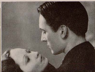
«Los hombres de mañana», film inglés de Leontina Sagan.

¿Y hay nada más hondo y humano que lo social? ¿Hay algo más hermoso y sublime que la vida misma?