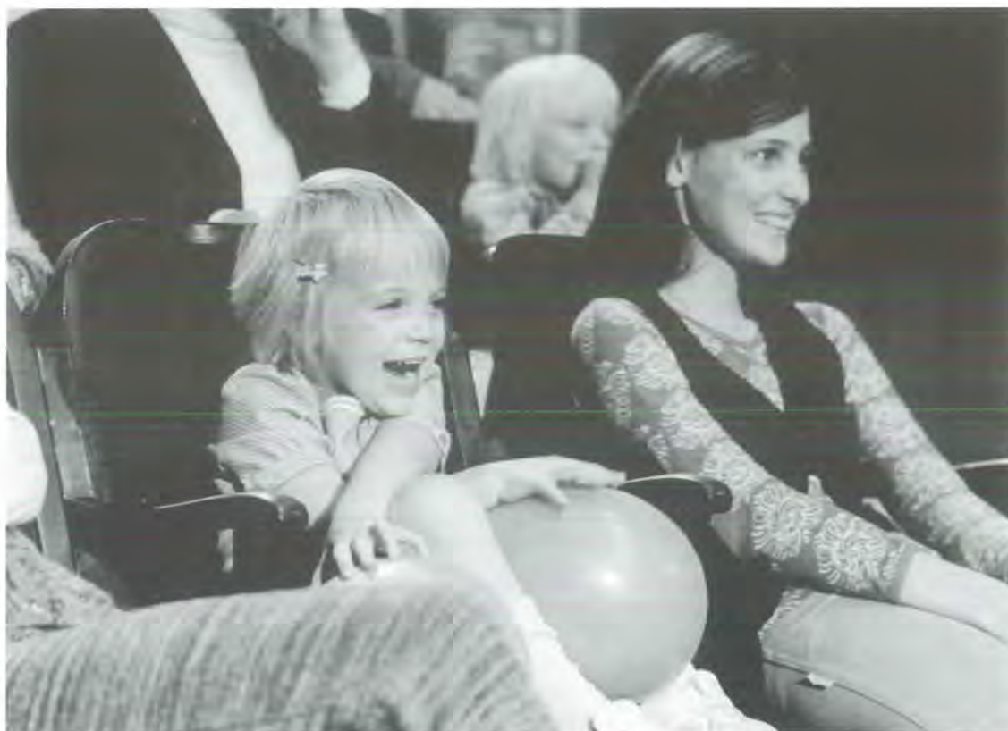
Zafarrancho en el circo (Parade, 1973)