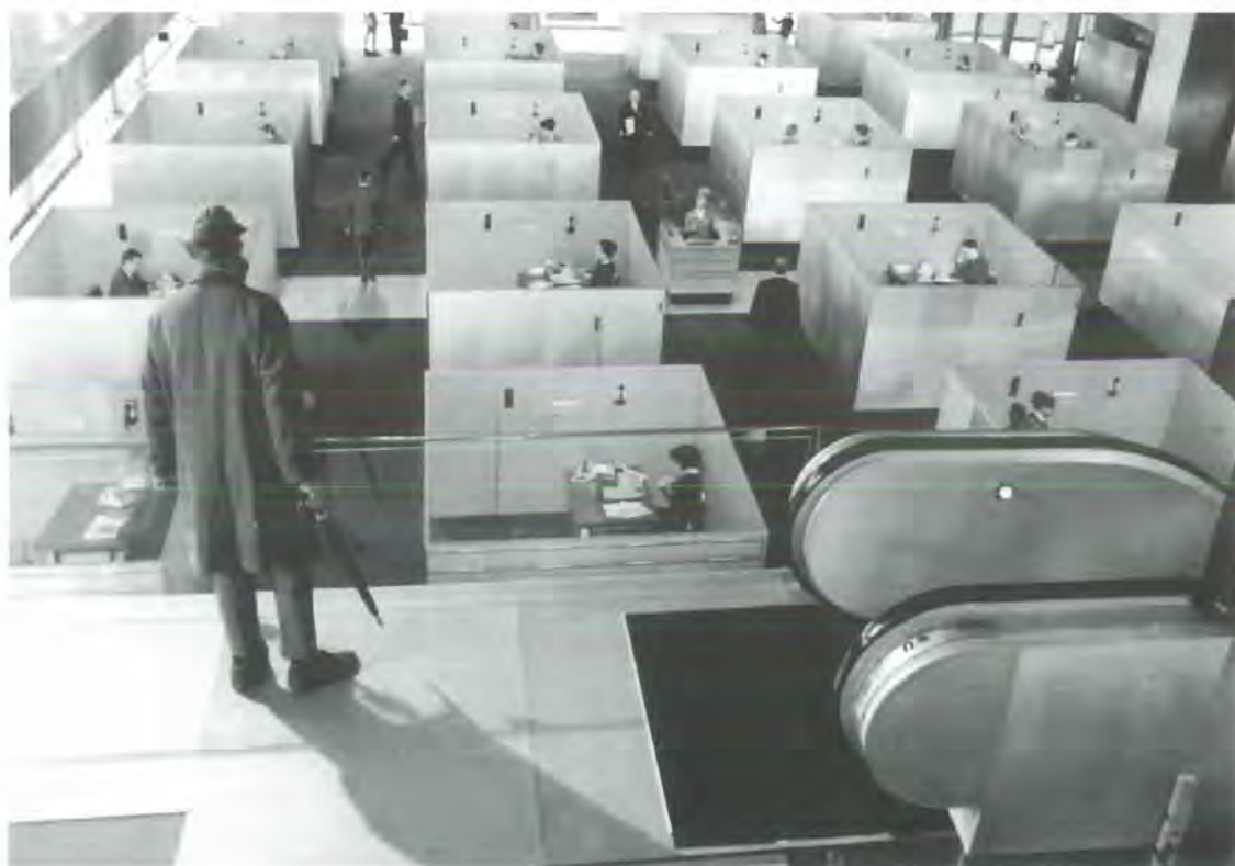
Playtime (Playtime, 1967) © PANORAMIC/CEPEC

6- Tati ironiza a propósito de la invasión sin trabas de los neologismos ingleses, que la burguesía "gala" adopta para demostrar su "modernidad".