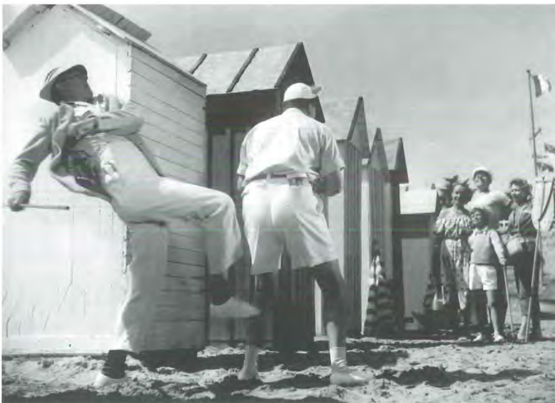
Las vacaciones del Sr. Hulot (Les vacances de M. Hulot, 1953)