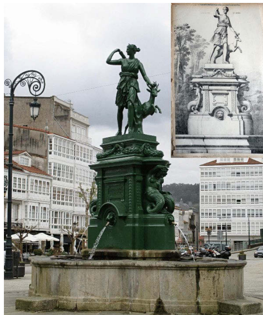
Fig. 3 Fotografía del autor con la fuente de la Diana Cazadora de Betanzos (A Coruña) y la plancha litográfica n°224 del catálogo de la fundición de Jean-Jacques Ducl et Fils por el que fue comprada en 1866

Los catálogos de fundición artística son trascendentales. Esta idea fue desarrollada por los industriales y comerciantes del siglo XIX vinculados a las fábricas de fundición francesas, destacando el catálogo de la Société Anonyme des Hauts-Forneaux et Fonderies d'Art du Val d'Osne , pues fue una de las fundiciones que más produjeron para todo el mundo; su fondo de empresa está conservado parcialmente entre los Archives Départementales de la Haute-Marne y en la Société Général Hydraulique et de Mécanique . No obstante, hay que tener en consideración que estos catálogos eran enviados por los propios dirigentes de las fábricas, así como por los arquitectos intermediarios entre las mismas y los compradores. Teniendo en cuenta que muchos de esos compradores eran instituciones públicas, es muy habitual encontrar fragmentos de estos preciados catálogos en sus archivos públicos. Como ejemplo se puede destacar la Diana Cazadora de la localidad coruñesa de Betanzos, la fuente monumental de fundición más grande de Galicia que fue realizada en la fábrica de Jean-Jacques Ducl et Fils –antecesora de Val d'Osne– en 1866 (Fig. 3) 3 , como copia de la célebre Diana de Versailles marmórea, que a su misma vez es copia de la original griega en bronce.