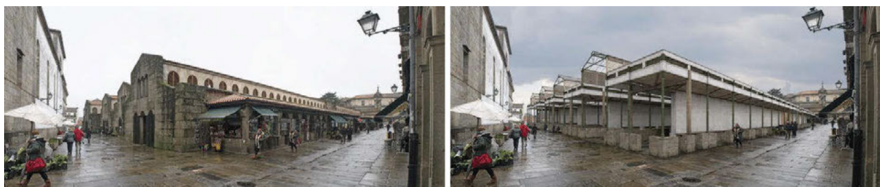
Fig. 4 Comparación. Izquierda: fotografía del actual mercado de abastos de Santiago de Compostela. Derecha: restitución 3D del antiguo. Realización: Carlos Paz, Centro de Infografía Avanzada de Galicia – GI-1530 HAAYDU USC

Del mismo modo que se pueden utilizar las restituciones 3D para la recuperación visual de las instalaciones fabriles desaparecidas, los renders también son una solución para dar forma gráfica y digital a las arquitecturas de hierro desaparecidas. El ejemplo que se adjunta es una comparación entre una fotografía del actual mercado de abastos de Santiago de Compostela y una restitución gráfica de cómo era en origen, construido en 1871 bajo proyecto del arquitecto Agustín Gómez de Santamaría, que se levantaba por una estructura de fundición producida en la fábrica de Alemparte en Carril, y demolido en 1937 para la construcción del actual edificio, obra de Joaquín Vaquero Palacios (Figs. 4 y 5). Se trata, pues, de una de los escasos ejemplos de arquitectura del hierro y cristal que existieron en Galicia, un tema de estudio que sí se ha abordado en otras partes de España (Navascués Palacios, 2007), pero no en Galicia, lo que pone de manifiesto la adecuación de estas herramientas digitales para el re-conocimiento de las arquitecturas industriales desaparecidas.