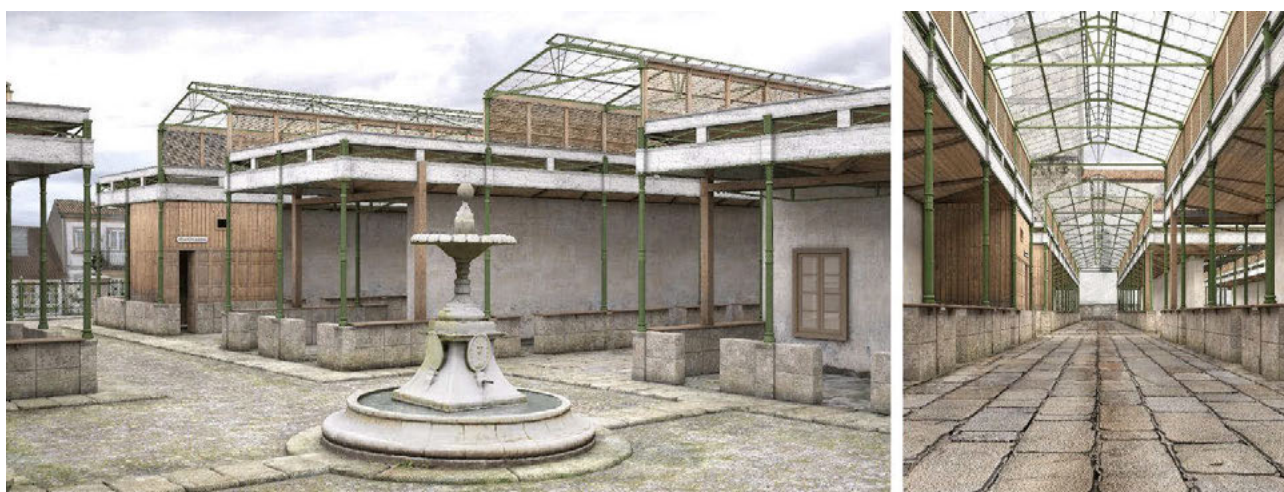
Fig. 5 Ejemplos de restitución 3D del antiguo mercado de hierro de Santiago de Compostela. Realización: Carlos Paz, Centro de Infografía Avanzada de Galicia – GI-1530 HAAYDU USC