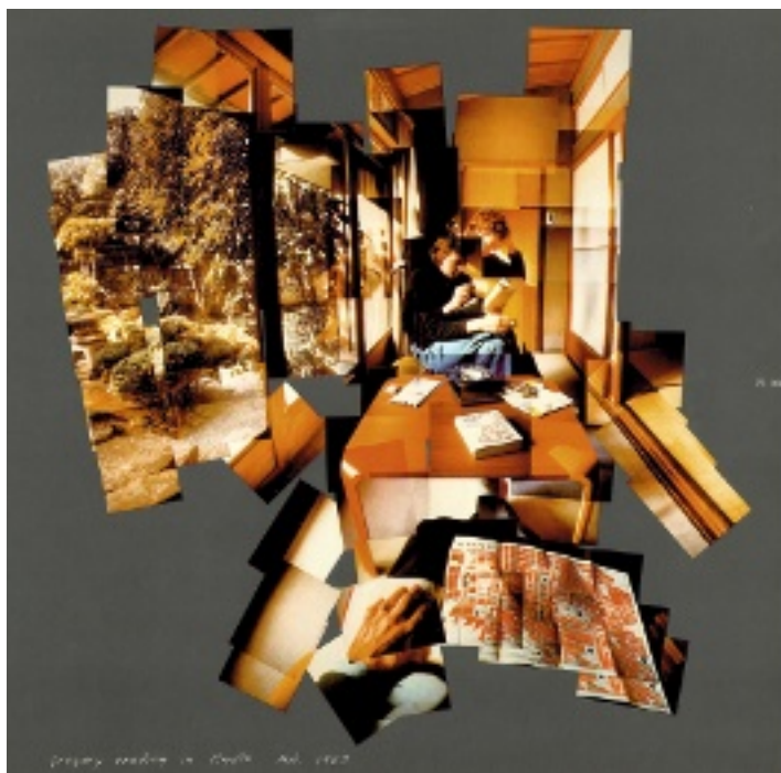
1. Hockney, David. Gregory Reading in Kyoto and Gregory Seeing Snow Fall , 1983. Kyoto. Wechsler 1984.Pp. 106 y 107.