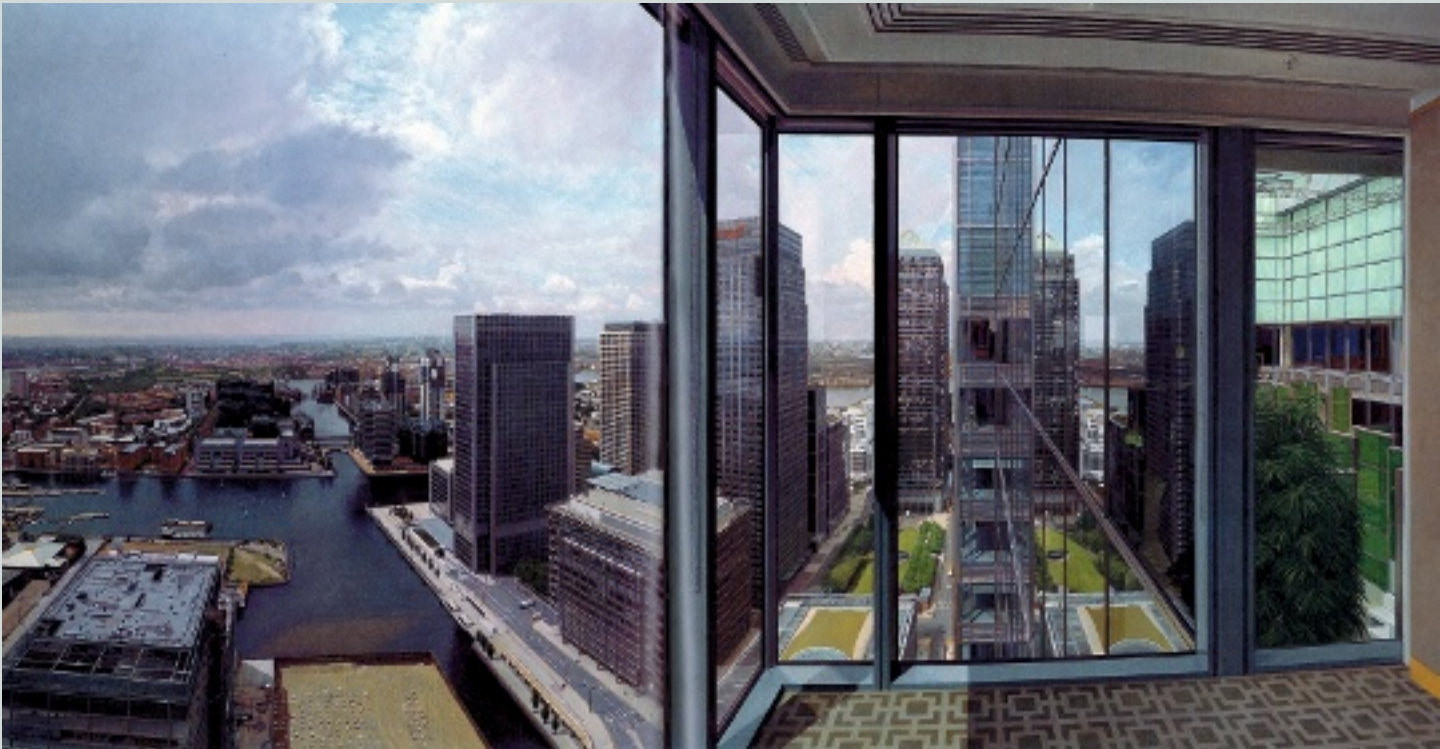
3. Head, Clive. South Kensington , 2009 and Canary Wharf , 2008. Paraskos 2010. Pp. 41 and 172.