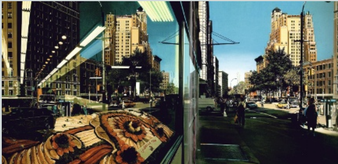
4. Estes, Richard. Citarella Fish , 1991. Arthur 1993. P. 53.