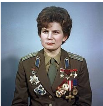
Fig 2. Valentina Tereshkova.

Valentina Tereshkova, fue seleccionada en 1962 junto a Tatiana Kuznetsova, Irina Soloviova, Zhanna Yiórkina y Valentina Ponomariova para formar parte del primer cuerpo de cosmonautas femenino de la historia (Altschuler y Ballesteros, 2016). De ese equipo sólo Valentina logró volar al espacio en 1963. Y no solo eso, dio 48 vueltas alrededor de la Tierra durante casi tres días en la Vostok 6, duración mayor que la de los astronautas del programa Mercury (Claramunt y Claramunt, 2012). Después del vuelo espacial, Tereshkova fue nominada Heroína de la Unión Soviética y distinguida con la Orden de Lenin. Siguió adscrita al programa espacial, estudió en la Academia de la Fuerza Aérea de Zhukovsky y se graduó como ingeniera espacial en 1969. Entre los numerosos reconocimientos recibidos destacamos que el asteroide 1671 lleva el nombre de "Chaika", su distintivo de llamada y también un cráter lunar (Altschuler y Ballesteros, 2016, Valentina Tereshkova, 2021).