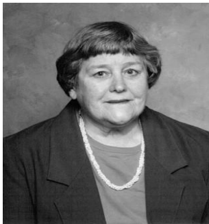
Fig 8. Yvonne Brill.