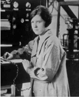
Fig 1. Pearl Young.

Pearl Young se graduó en la Universidad de Dakota del Norte con una triple especialización en Física, Matemáticas y Química (Allen, 2015). Tras su graduación, enseñó Física en esa misma universidad.