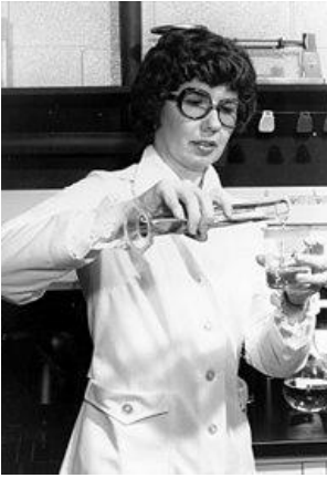
Fig 11. Barbara Askins.

Nacida en 1939 en Belfast, Tennessee, Askins fue una de las primeras mujeres estadounidenses en hacer contribuciones significativas en el campo de la exploración espacial. Askins comenzó a trabajar en el Centro de Vuelo Espacial Marshall en 1975 (Macho, 2018b), tras completar un máster en Química. En Marshall, el trabajo de Askins se centraba en mejorar la calidad de las imágenes fotográficas astronómicas y geológicas (Uve, 2018). En aquel momento a pesar de la gran información de las imágenes estas apenas eran visibles.