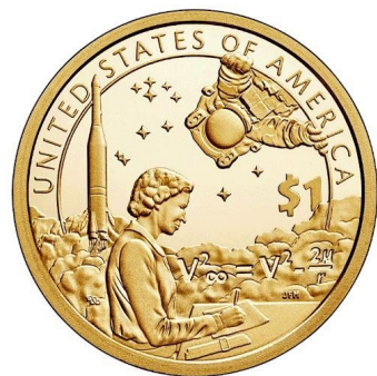
Fig 7. Moneda conmemorativa