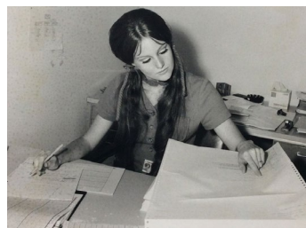
Fig 5. Parrish Nelson Hirasaki.

Parrish Nelson Hirasaki se licenció en Ingeniería Mecánica en 1967 por la universidad de Duke y poco después comenzó a trabajar en el programa espacial en Houston (Brueck, 2019; Johnson, 2019). Hirasaki trabajó en todas las misiones tripuladas desempeñando un papel clave en la misión del Apolo 13. Parrish utilizó el análisis térmico para identificar el corredor de entrada seguro para la nave dañada.