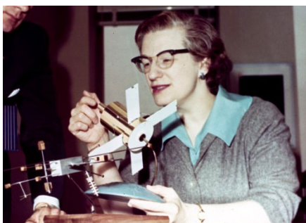
Fig 9. Nancy Roman.