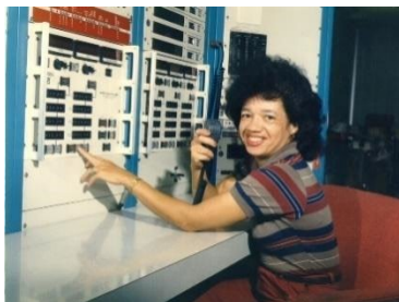
Fig 4. Christine Darden.

Christine (Mann) Darden obtuvo un máster en Matemáticas en 1967 y poco después ingresó en la NACA (Palomino y Sefcik, 2019). Darden comenzó su trabajo como “computadora humana” junto con otras grandes mujeres como Katherine Johnson, Dorothy Vaughan o Mary Jackson, realizando cálculos matemáticos para los ingenieros. En 1973 ascendió a ingeniera aeroespacial y se convirtió en una de las primeras mujeres en ocupar el citado puesto en la NASA (Macho, 2018a), donde escribió un programa informático, que resultó en una revolución del diseño aerodinámico para reducir la explosión sónica.