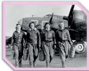
Figure 1. These four women are members of a group of Women Airforce Service Pilots (WASPs). U.S. Air Force photo (1944)