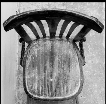
montones de basura