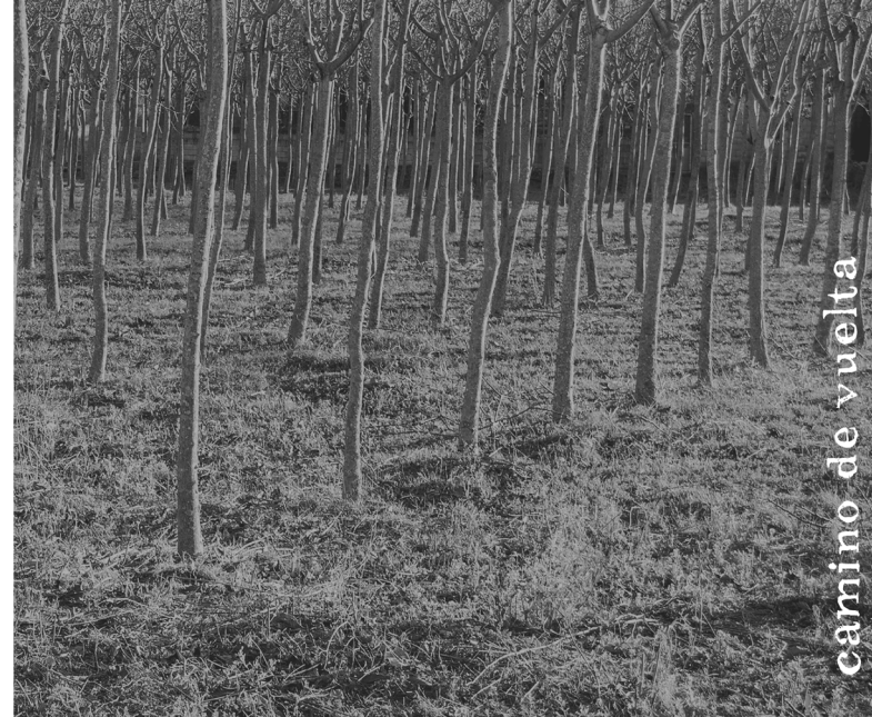
camino de vuelta