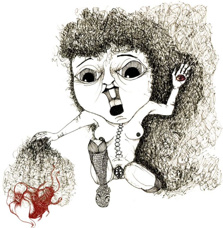
Fig. 3 Vagina Dentata I. Fuente: #Bestiarium Femineum, Alissia, 2019. Tinta y Collage sobre papel Canson 300 gr.

La herencia heterocentrista y patriarcal que sufre la sociedad actual es un discurso legitimador de prácticas de dominio y explotación que garantiza el derecho masculino de acceso físico, económico y emocional sobre nosotras. Y esta situación ancestral se refleja perfectamente en el mito de la Vagina, que representa una “mujer híbrida (ciborg)” con unos órganos genitales dentados que al sistema patriarcal no le sirven ni para el disfrute físico masculino ni para la reproducción. Obviando lo evidente: que le deben servir a la propietaria de los mismos, sin que nadie ajeno a ella pueda modificar su cuerpo, su deseo o su libre albedrío en general.