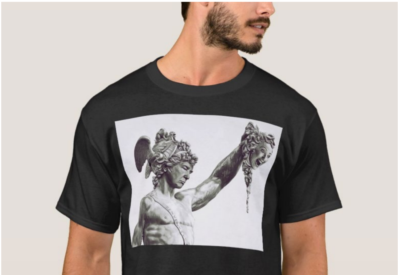
Fig. 2 Reinterpretación de Medusa como Hilary Clinton, usada por Trump en su campaña electoral.

En los estudios antropológicos mencionados anteriormente encontramos que las leyendas contadas son semejantes, independientemente de su origen: un relato procedente del Chaco (México), explica que el héroe mítico “Carancho” rompió los dientes vaginales de las mujeres, para poder copular y usarlas para la consecuente reproducción humana. En la India hay una leyenda sobre un brahmán que tiene una mujer con la vagina dentada. Éste contrata a cuatro hombres de castas inferiores para desdentarla, (violación múltiple), finalmente el último hombre lo logra y el brahmán se casa con ella, otorgándole el estatus de normal debido a que, al estar desdentada la vagina, la mujer se convierte en arquetipo de mujer heteronormal que no amenaza con la castración al marido y puede concebir. También, según los indios Waspishiana y Taruma, la primera mujer tenía un pez carnívoro dentro de su vagina. Historia similar es la que nos presenta Erich Neumann con su “Terrible Mother” donde un pez habita en su vagina y el héroe rompe el único diente de la vagina (herencia de las Greas) y la fornicia. Por último, no hay que olvidar a la Gorgona Medusa, con su boca llena de dientes (sustitutiva de la vagina ya que se la representa como una cabeza cortada) que aparece en la mitología grecolatina y que hoy en día se sigue utilizando, la mayoría de las veces, para denostar a mujeres políticas de gran poder.