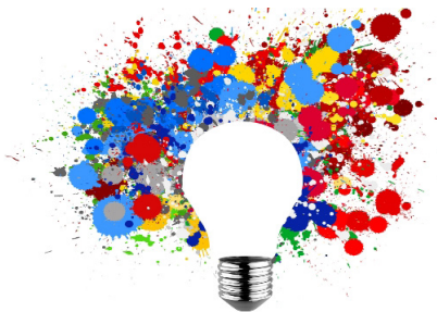
Imatge 1. (Cabré, 2018). Autoretrat d'una docent plurilingüe.

L'ús d'aquest enfocament també es justifica pel fet que, en situacions