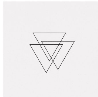
Imatges 2 i 3. (Cabré, 2018). Fotografies que representen el concepte de competència plurilingüe per a dues mestres.