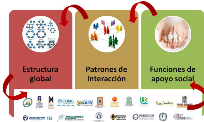
Figura 2. Composición de la Red Construcción propia

La red se configura a partir de tres elementos