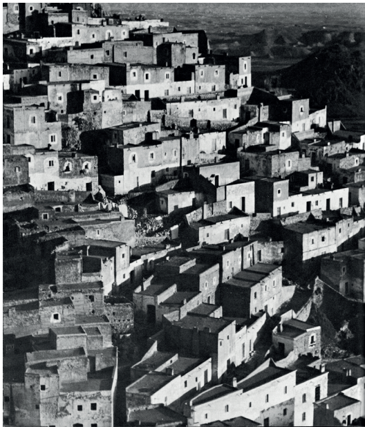
Figura 7. Bernard Rudofsky, fotografía de Mojacar recogida en el catálogo Arquitectura sin arquitectos , 1964.

Figure 7. César Ortiz Echagüe, Mojacar (Spain), photograph nº 38 collected in the catalog of Architecture without Architects .