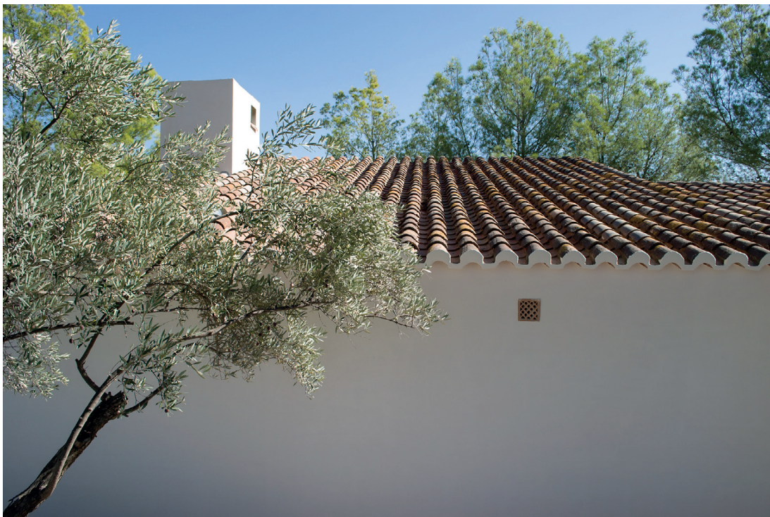
Figura 5. Bernard Rudofsky, "La Casa" fotografía desde el acceso tomada en 2011.