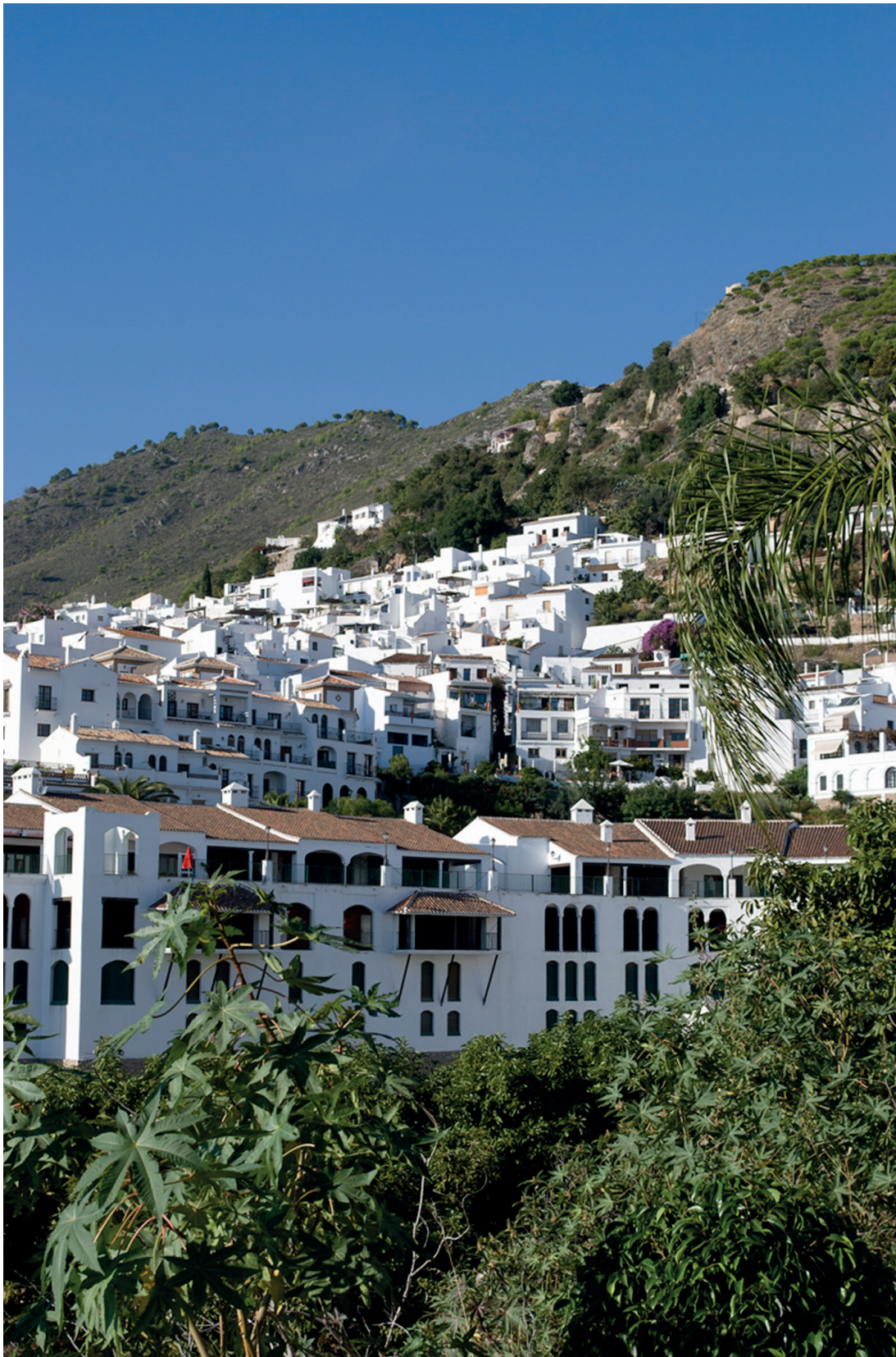
Figura 4. Frigiliana en la actualidad. La imagen no debe de ser muy diferente a la que recibió a Bernard Rudofsky en 1969.