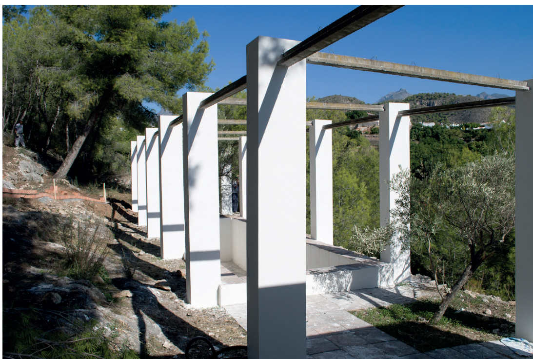
Figura 11. Bernard Rudofsky, fotografía de la piscina de La Casa , 2011.