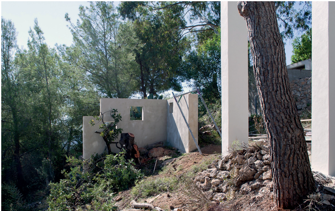
Figura 9. Detalle del diedro perforado en el jardín de La Casa en Frigiliana. La fotografía, fue tomada en 2011, justo en el momento en el que el algarrobo fue podado, como puede apreciarse en la instantánea.