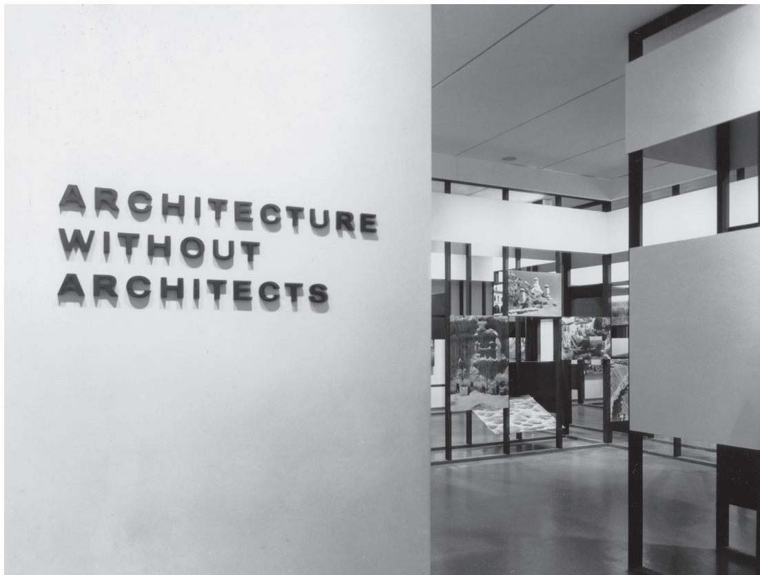
Figura 2. Bernard Rudofsky, Arquitectura sin arquitectos , MoMA (Nueva York), 1964; imagen de la exposición.