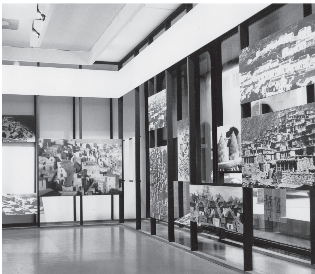
Figura 3. Bernard Rudofsky, Arquitectura sin arquitectos , MoMA (Nueva York), 1964. En la imagen pueden verse varios de los ejemplos que ilustran el magistral encaje de esta arquitectura en el entorno. La española Mijas aparece en la esquina superior derecha, en una fotografía realizada por el propio Bernard Rudofsky.