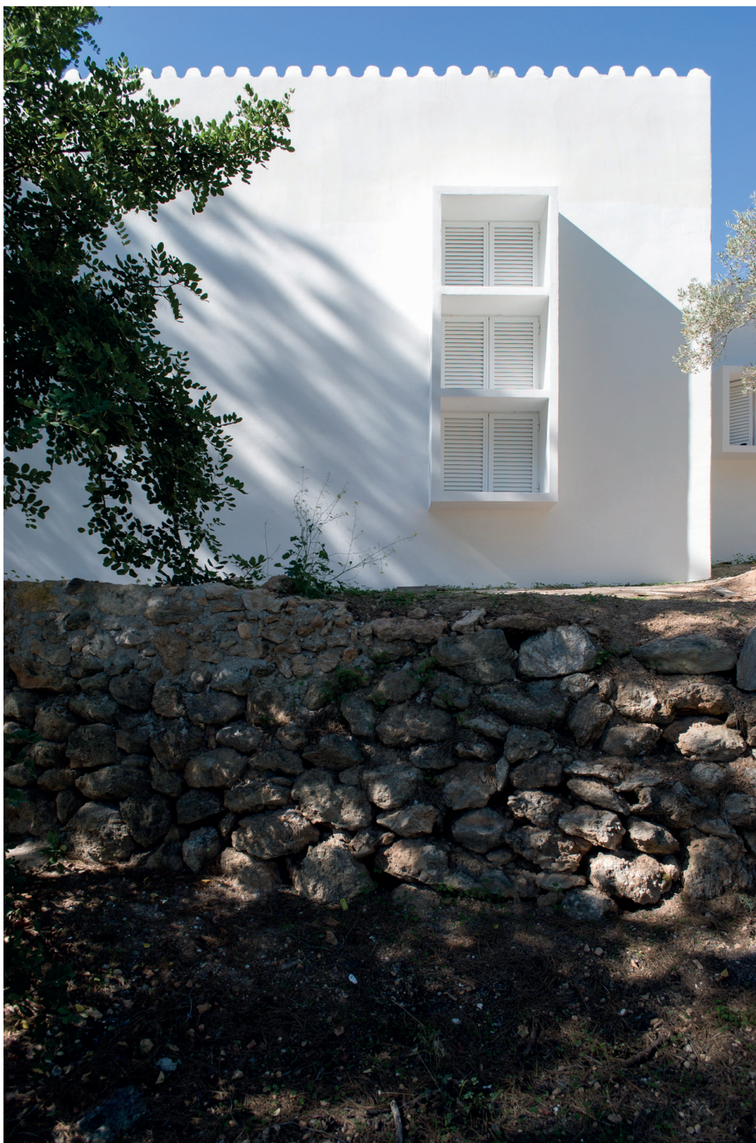
Figura 1. Bernard Rudofsky, detalle de La Casa , Frigiliana (España) 2011.